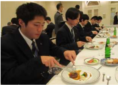
(ナイフ&フォークでいただきます)