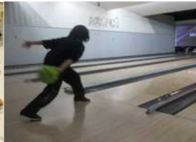
(ストライク目指します！！)