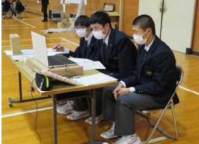
(オンライン形式のガイダンス)