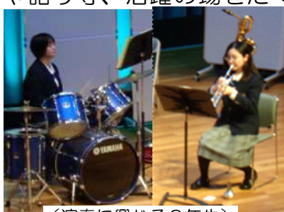
(演奏に興じる3年生)

今回は賛助として参加しました。ドラム演奏、司会や語り等、活躍の場をたくさんいただき、とてもよい経験をする事ができました。