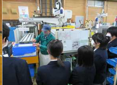
(フルヤモールド、タニタ秋田などを見学しました)