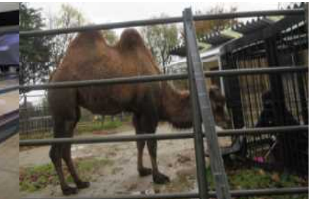
(ラクダとたわむれました)