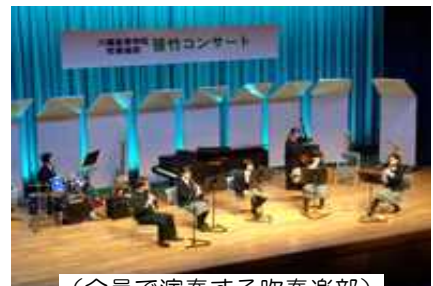
(全員で演奏する吹奏楽部)

少人数でもお客様に楽しんでいただけるような演奏会を目指し、さまざまな編成や語りと音楽を融合した作品に挑戦しました。生徒達の頑張りで、今年の集大成となるステージになりました。開催に際し、お力添え頂いた地域の皆様に心より感謝申し上げます。